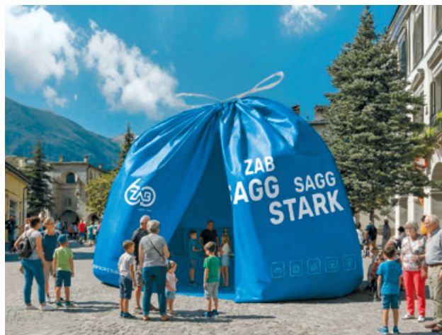
Mit einer Roadshow und vielen weiteren Aktivitäten wird der ZAB 2026 und 2027 sein 60-jähriges Jubiläum feiern

Im Zentrum steht eine Roadshow durch alle 33 Gemeinden des Verbandes sowie ein grosser Tag der offenen Tür am 22. Mai 2027.