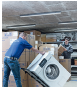
Lieferung / Montage