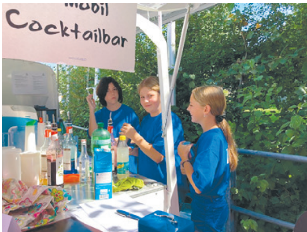
Zusammenschlussfest in Ganterschwil