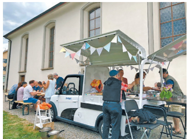
Suppenausschank in Mosnang