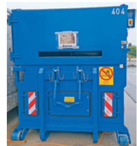
Neuer Presscontainer für Karton.

Weiter bestehen Papier- und Kartonsammlungen durch die Vereine. Die Vergütung für die gesammelten Papier- und Kartonmengen an diesen Strassensammlungen fliesst vollumfänglich in die Vereinskassen. Es handelt sich für die Vereine um einen willkommenen Zustupf.